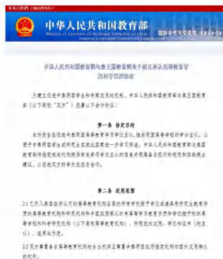
中泰高等教育互认